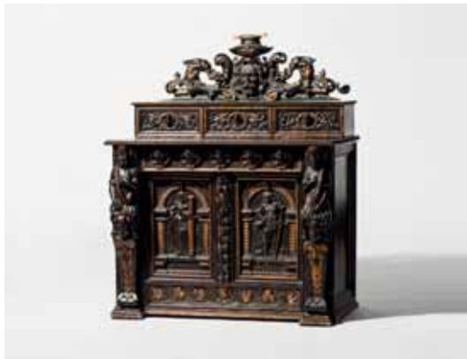
31 Een gelakt en verguld tweedeurskastje