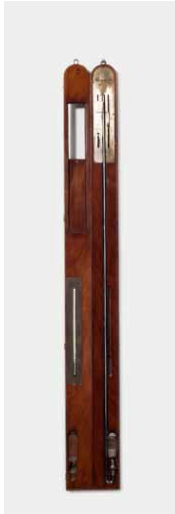
24 Een Franse reisbarometer Parijs, circa 1840 Met mahoniehouten kast en verzilverde messing schaalplaten. De thermometer met schalen in Celsius en Reaumur. Barometerreservoir met kraantje. H. 97 cm € 600 - 1.000