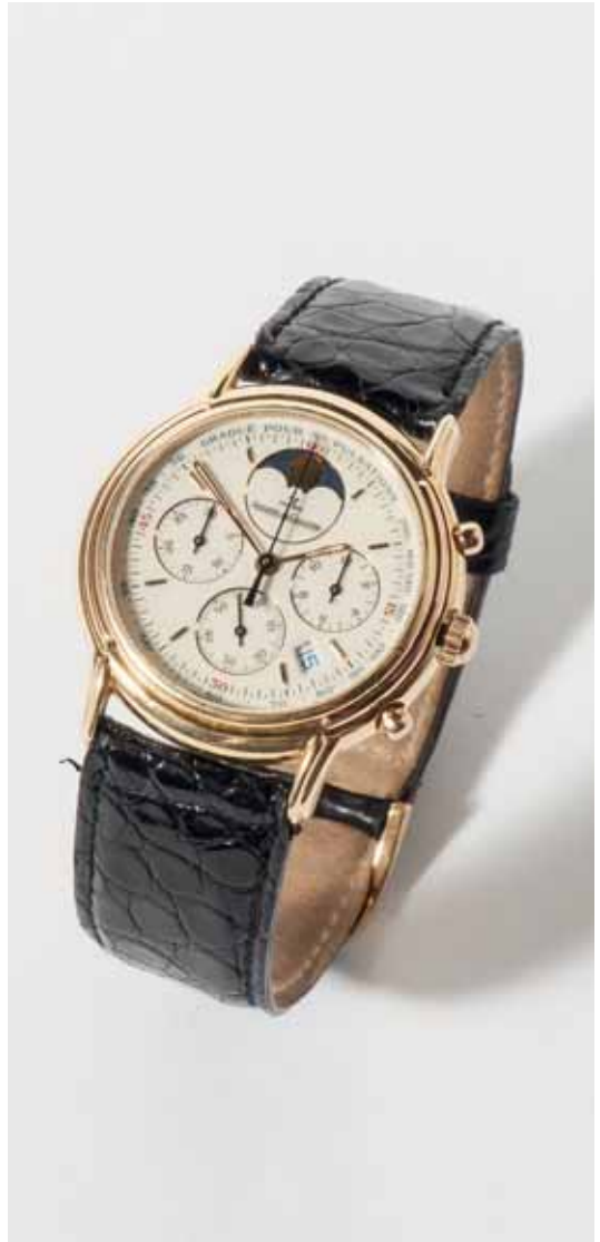
20 Een 18K gouden Jaeger-LeCoultre Odysseus chronograaf Zwitserland, 20ste eeuw

Quartz uurwerk, met maanfase en datum. Witte wijzerplaat, saffierglas, lunette met roségoud. De kast genummerd Odysseus No 2405 en 165 7 3 . Zwart leren band met originele 18K gouden sluiting.