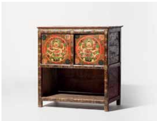
33 Een gepolychromeerd houten kast