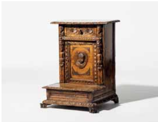
32 Een notenhouten bidbankje