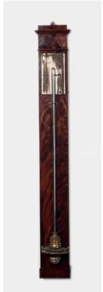
25 Een Franse stickbarometer door Gallet Parijs, circa 1840 Met mahoniehout gefineerde kast en verzil- verde schaalplaat. Gesigneerd Gallet à Paris . Rond het glasreservoir twee verguld mes- sing beugels. H. 110 cm € 1.500 - 2.000