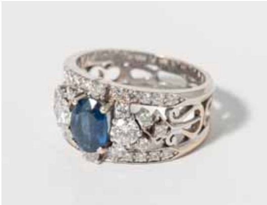
18 Een 18K witgouden, diamanten en saffier bandring 20ste eeuw

Gecentreerd door een ovaal gefacetteerde blauwe saffier met entourage van briljantgeslepen diamanten in een opengewerkte 'harp'-zetting.