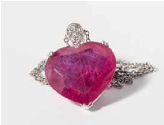
19 Een 18K witgouden collier met robijn en diamanten hanger 20ste eeuw

De hartvormig geslepen robijn met briljantgeslepen diamanten detail op het hangoog aan schakelcollier.