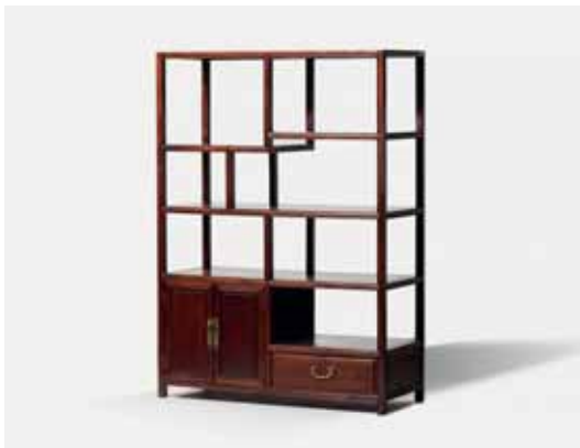
34 Een hardhouten Chinese porseleinkast